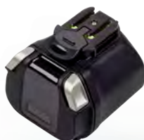
Guscio batteria aseptica