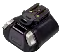
Guscio batteria aseptica